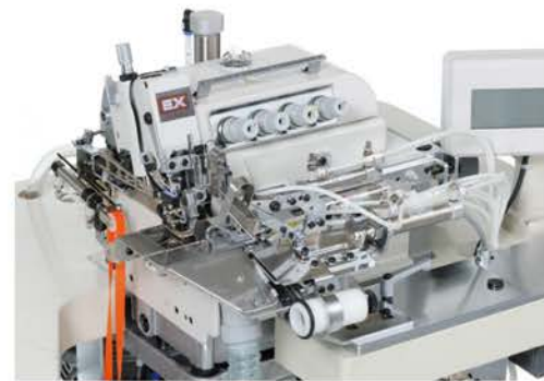
PHN-200/EX5105-12/223N-4/KS379/PT 裾引きユニット (1本針シリンダーベッド型オーバーロックミシン搭載) Blindstitch Hemming Unit (equipped with 1-needle, cylinder bed, overedger machine) 下摆折缝自动组装机 (搭载单针小方头式包缝缝纫机)