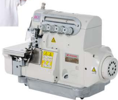
MX5203-M03/323-4/KS0E/D232/Y2261 M縫い仕様 1本針オーバーロックミシン M-stitch specification, 1-needle, overedger machine M縫式样 单针包缝缝纫机